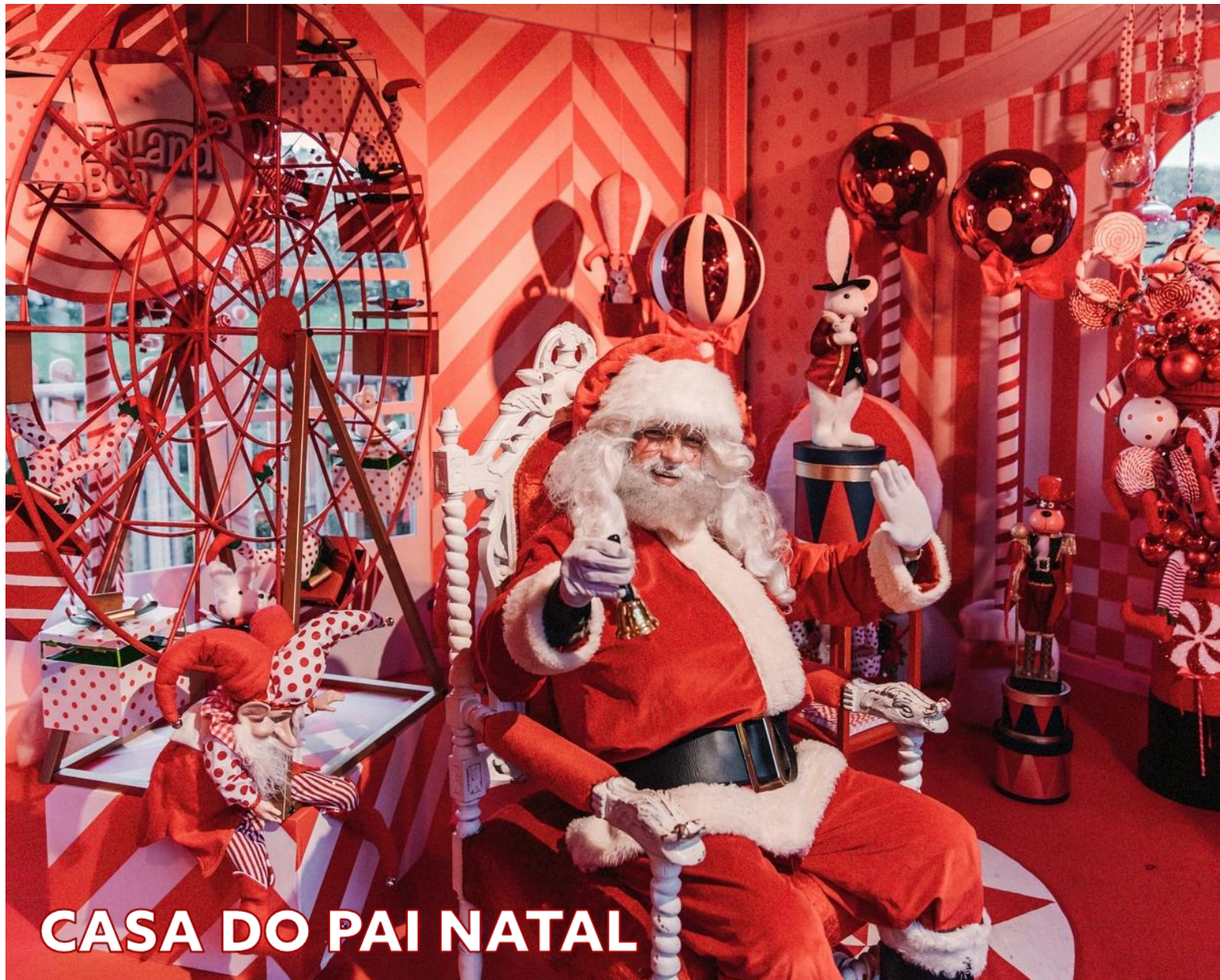
CASA DO PAI NATAL