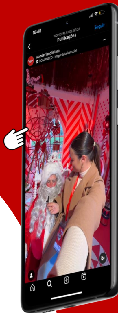
UM DIA NO WONDERLAND